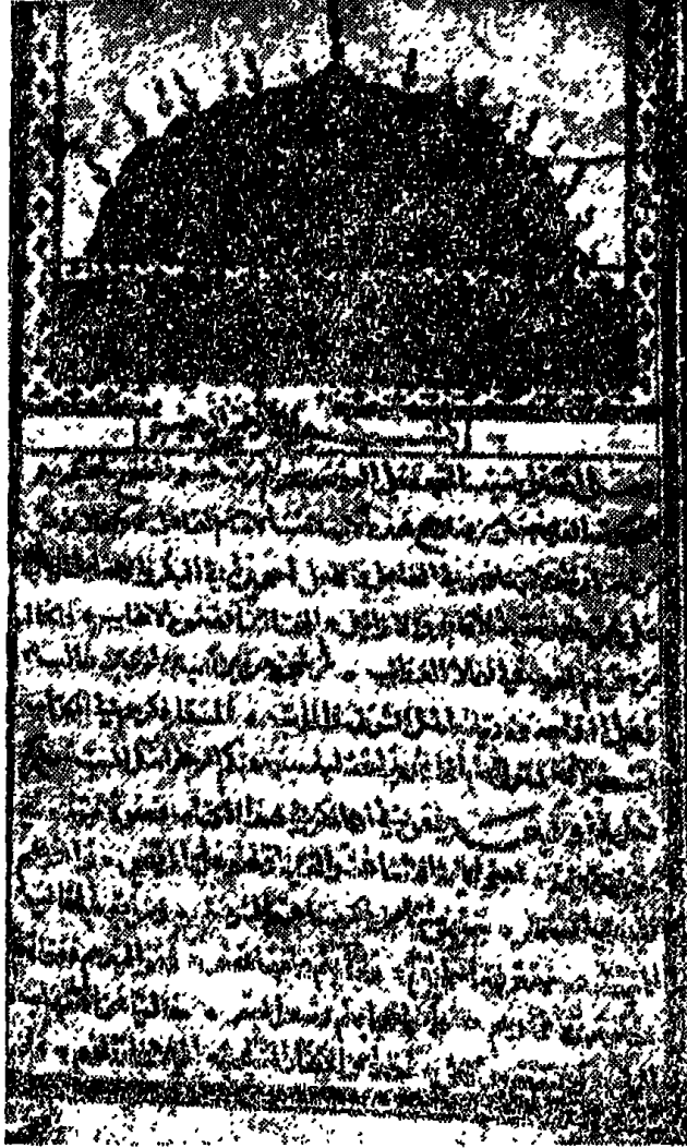
صورة الصفحة الأولى من النسخة الخطية (للأب أنستاس الكرمللي) في مكتبة دار الآثار القديمة - بغداد - ويرجع عهد كتابتها إلى عام ١١٠٥ وقد قوبلت هذه النسخة المطبوعة عليها